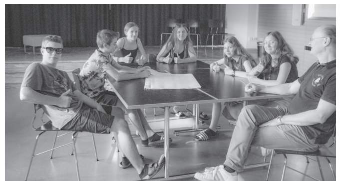
Im Konflager in Locarno, 2. - 4. September

18.00 - 19.00 Vesperfeier «...der Heil und Leben mit sich bringt...» Ort: Klosterkirche Kartause Ittingen