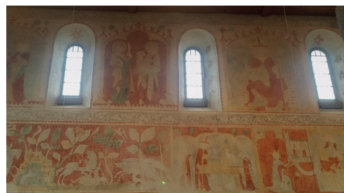
Freske an der Nordwand der Kirche Oberwinterthur: Sigibert, der Sohn von König Dagobert, wird bei einem Jagdunfall tödlich verletzt.